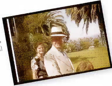
Thomas und Elisabeth Mann vor dem Exil-Haus in Pacific Palisades bei Los Angeles

Das Thema ist heute besonders aktuell, weil das kürzlich von Bundespräsident Frank-Walter Steinmeier eröffnete „Weiße Haus des Exils“ in Thomas Manns ehemaligem Wohnsitz bei Los Angeles einen transatlantischen Dialog aufgenommen hat und so wie Thomas Mann in seinem „Doktor Faustus“ den problematischen Zustand unserer heutigen Welt reflektiert.